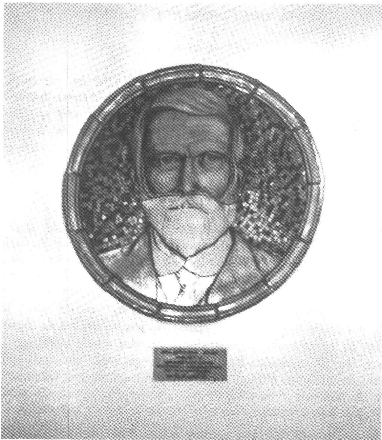
Plaquette Dirk van Eck